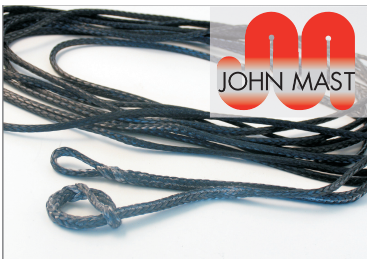
Komplet backstag/hækstag i Dyneema Pro

Disse stag vejer betydeligt mindre end wire-stag og er lige så stærke. Faktisk vejer Dyneema op til 10 gange mindre end wire.