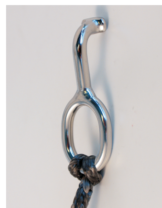
T-terminal for Dyneema stag

Sejler du en klassebåd skal du være opmærksom på at der kan være regler omkring back- og hækstag der skal overholdes.