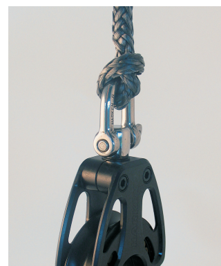
Øje indstukket på blok