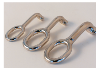
T-terminal med øje

Dimension angiver hvilken størrelse fæsteplade terminalen passer til.